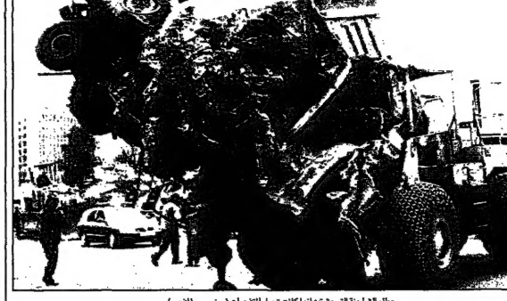
مطار الشارقة في وقتها، اذ كانت تحمل الطائرة في تجربتي (الذبح)

واشنطن، 13 آب (أغسطس) - واشنطن اغلقت سفارتها في بيروت وصنعاء.. ودعت رعاياها في الخليج لمضاعفة الحذر. ذعر امني يجتاح السفارات الامريكية مع تدفق التهديدات واعتقالات اخرى في كينيا.. ومشورة اسرائيلية سبقت الانفجار. وادعت السفارة الامريكية في بيروت انها اغلقت سفارتها في صنعاء في وقت سابق من هذا الاسبوع. وقالت السفارة في بيان انها اغلقت سفارتها في صنعاء في وقت سابق من هذا الاسبوع. وقالت السفارة في بيان انها اغلقت سفارتها في صنعاء في وقت سابق من هذا الاسبوع.